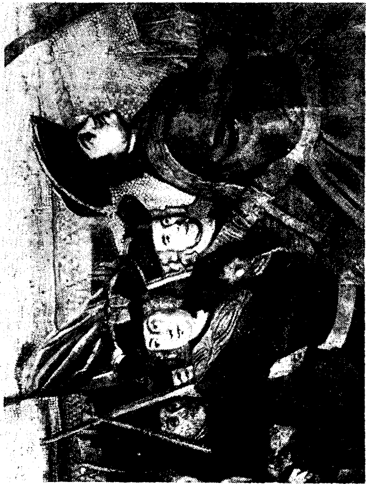
МОЗАИЧНАЯ КАРТИНА ЛОМОНОСОВА „ПОЛТАВСКАЯ БАТАЛИЯ“. ДЕТАЛЬ