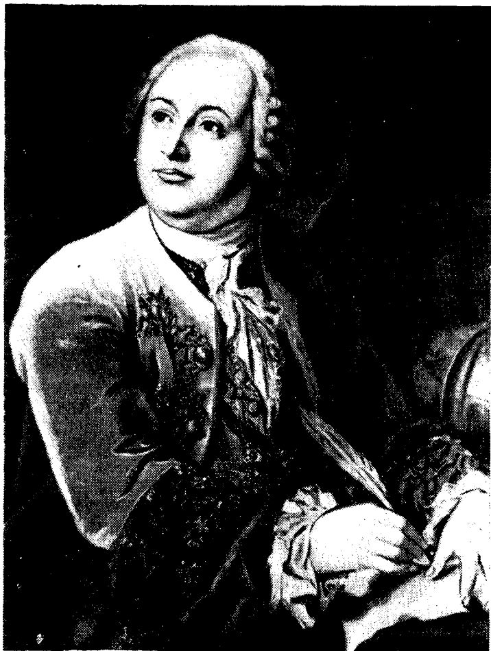
М. В. ЛОМОНОСОВ